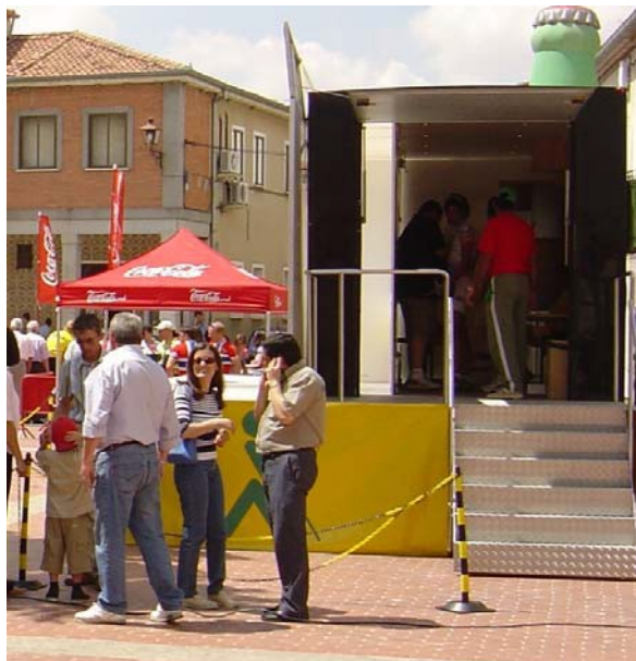
ESCALERA DE ACCESO