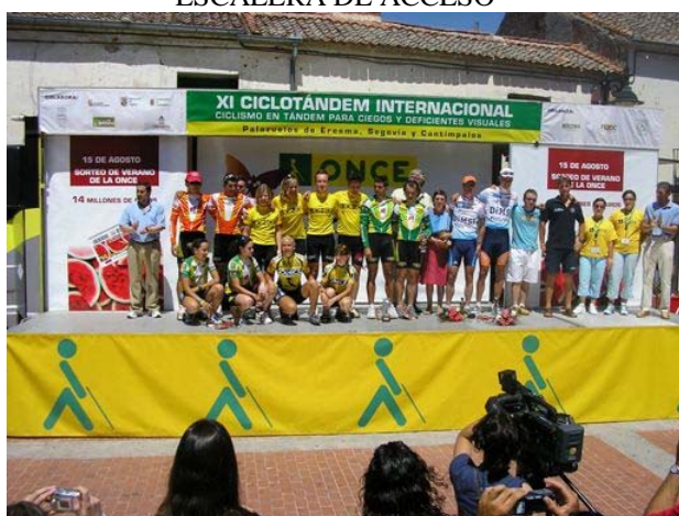
PODIUM TOTALMENTE ABIERTO